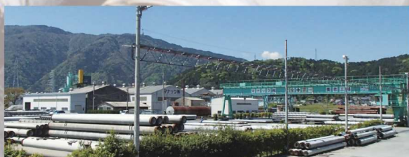
■ 養老工場 〒503-1331 岐阜県養老郡養老町橋爪575-1 TEL0584-34-1335 FAX0584-34-0124