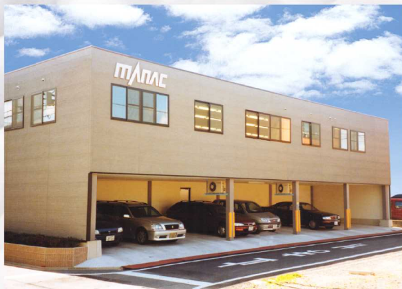
■ 本 社 〒452-0005 愛知県清須市西枇杷島町恵比須17 TEL052-501-5351 FAX052-502-4329